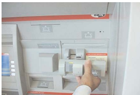
Echipamentul instalat în fața slot-ului bancomatului (skimmer).

În același timp este montată și o cameră de supraveghere de dimensiuni foarte mici care înregistrează momentul în care este introdus PIN-ul cardului. După ce aceștia au obținut toate datele cardului victimei aceștia fac o clonă a cardului furat și golesc conținutul victimei așa că... ATENȚIE!