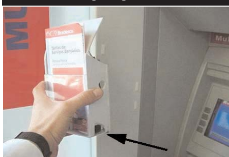
Codul PIN este citit cu ajutorul unei camere de supraveghere de dimensiuni foarte mici, instalată într-un loc ascuns.